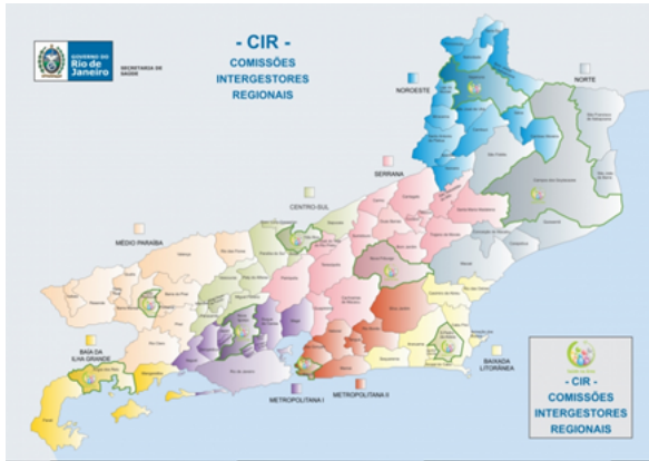
Figura 1 – Regiões de Saúde do Estado do Rio de Janeiro.

O Hospital Estadual dos Lagos Nossa Senhora de Nazareth estrutura-se com perfil de média e alta complexidade para maternidade de alto risco, cirurgia geral e ginecológica, para demanda de internação referenciada através da Central de Regulação da SES/RJ.